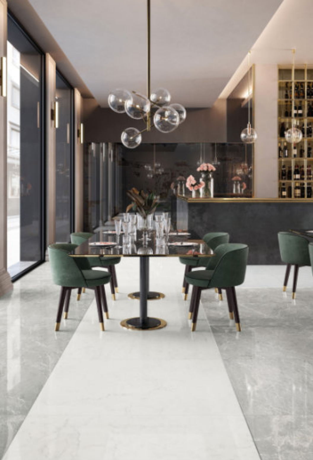
Pure Supreme Grey 120 × 120