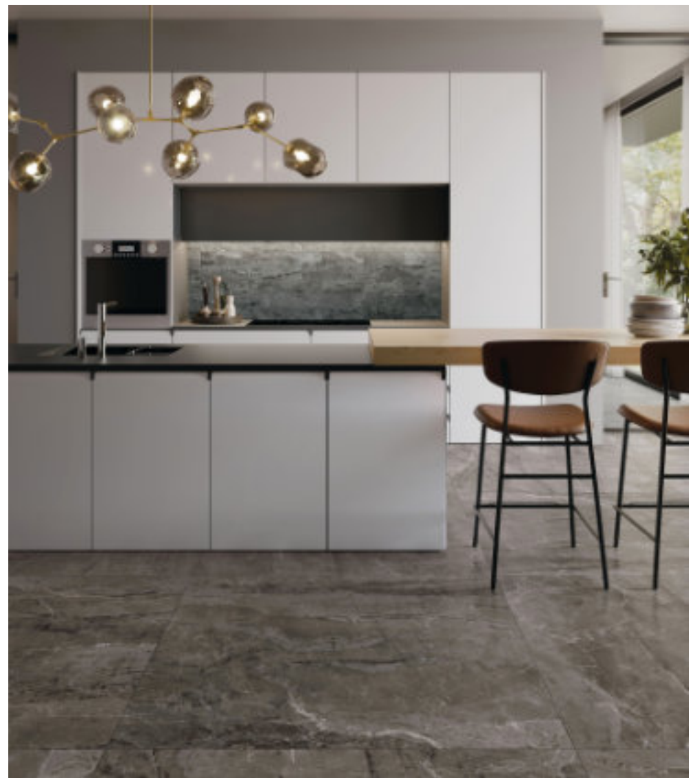
Pure Royal Dark 120 × 120