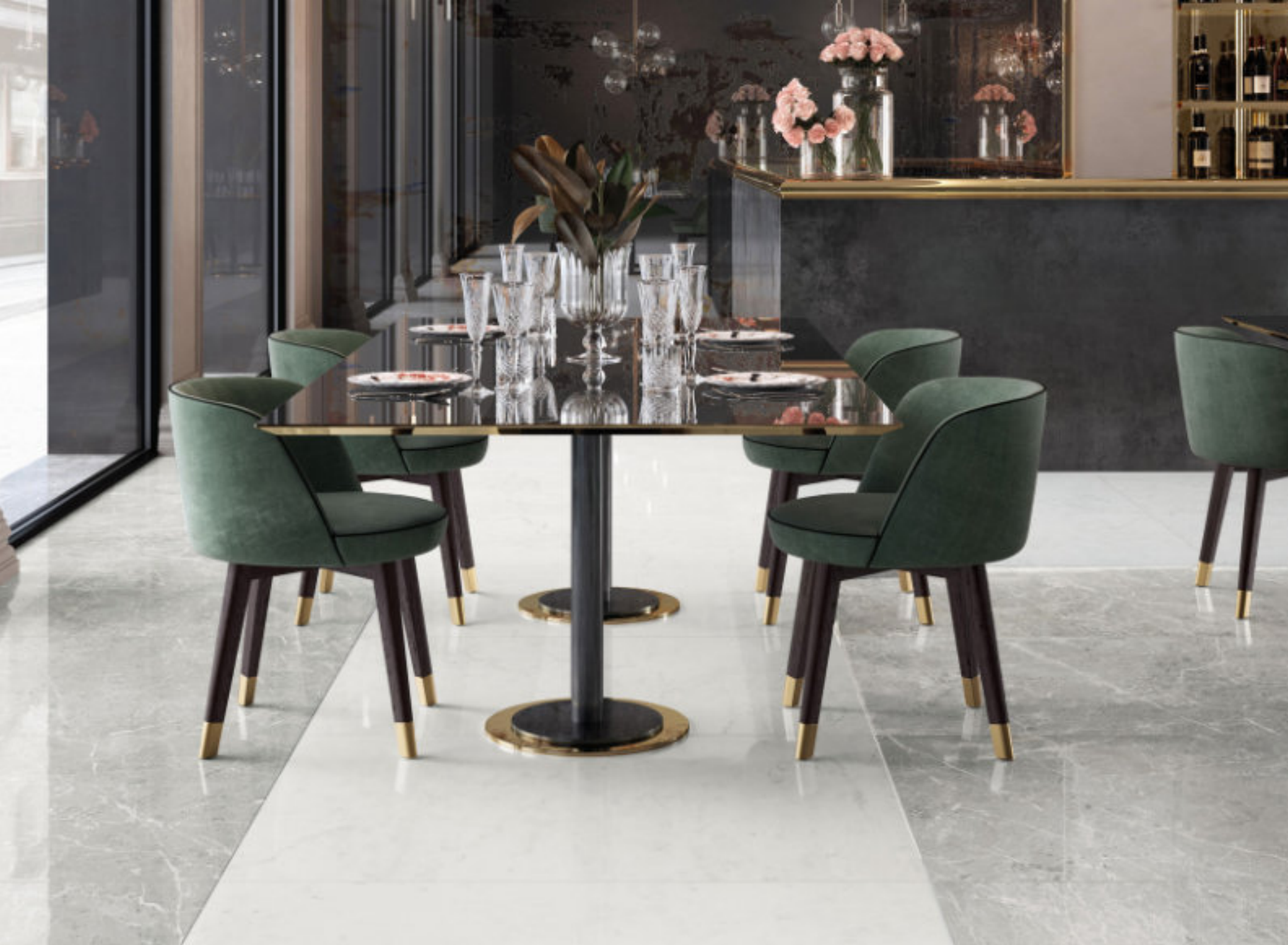
Pure Supreme Grey 120 × 120