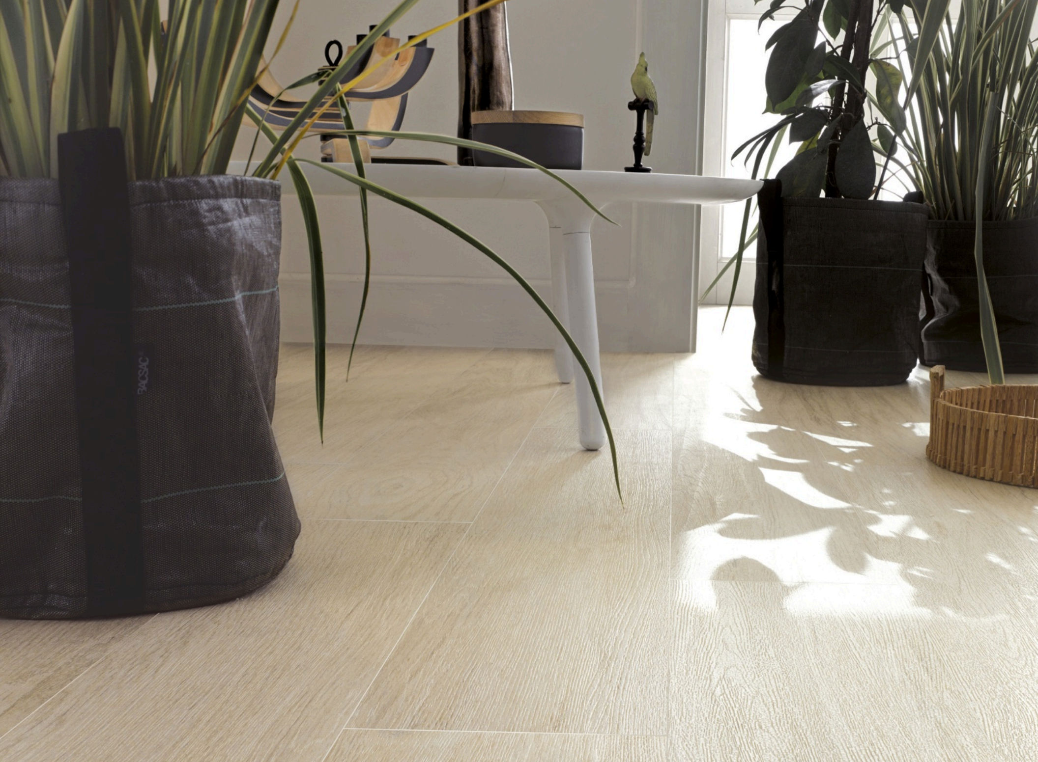
Forest Acero 33 × 300 (sobre pedido)