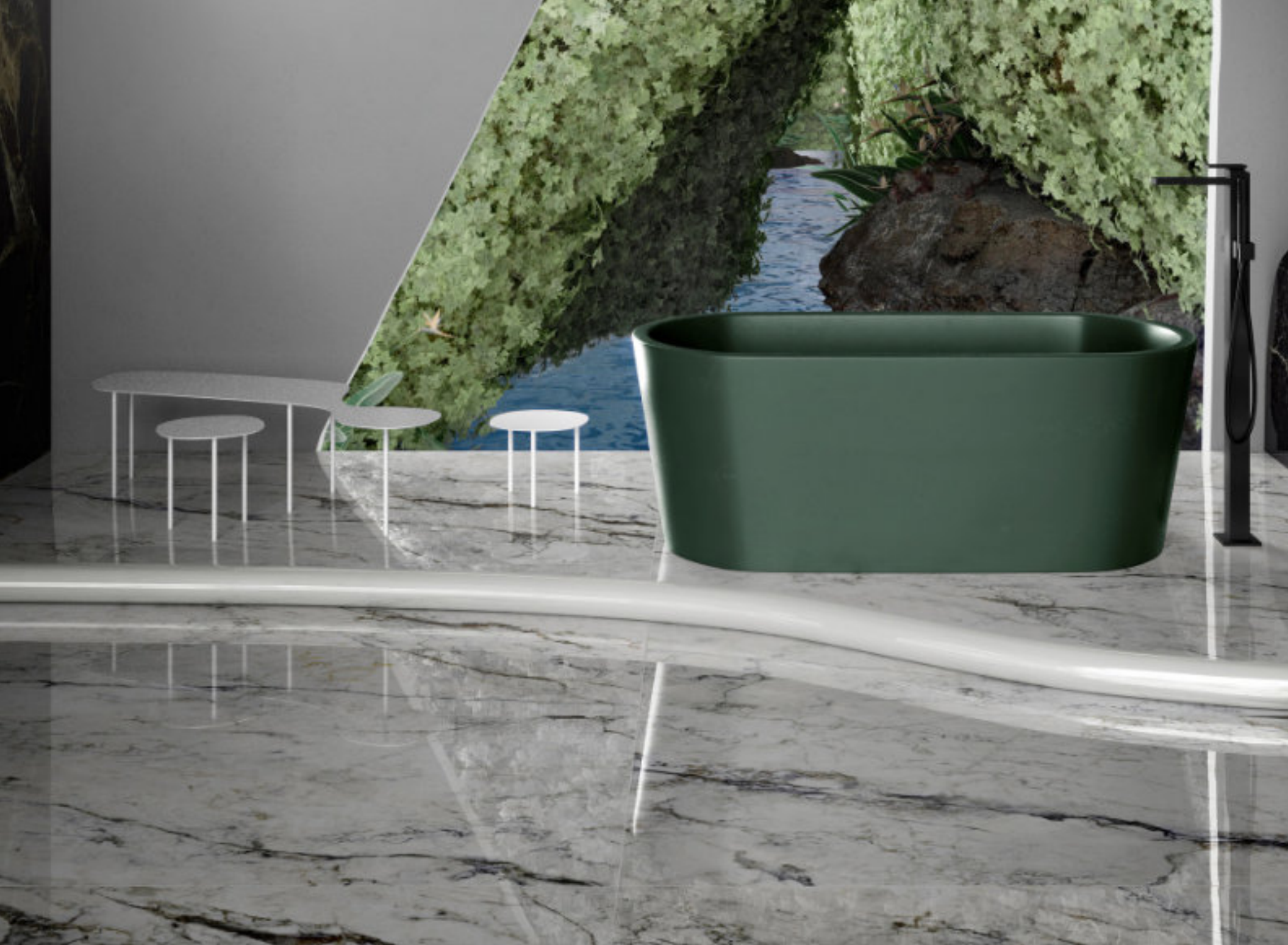
Dream Pure Breccia Capraia 120 × 120