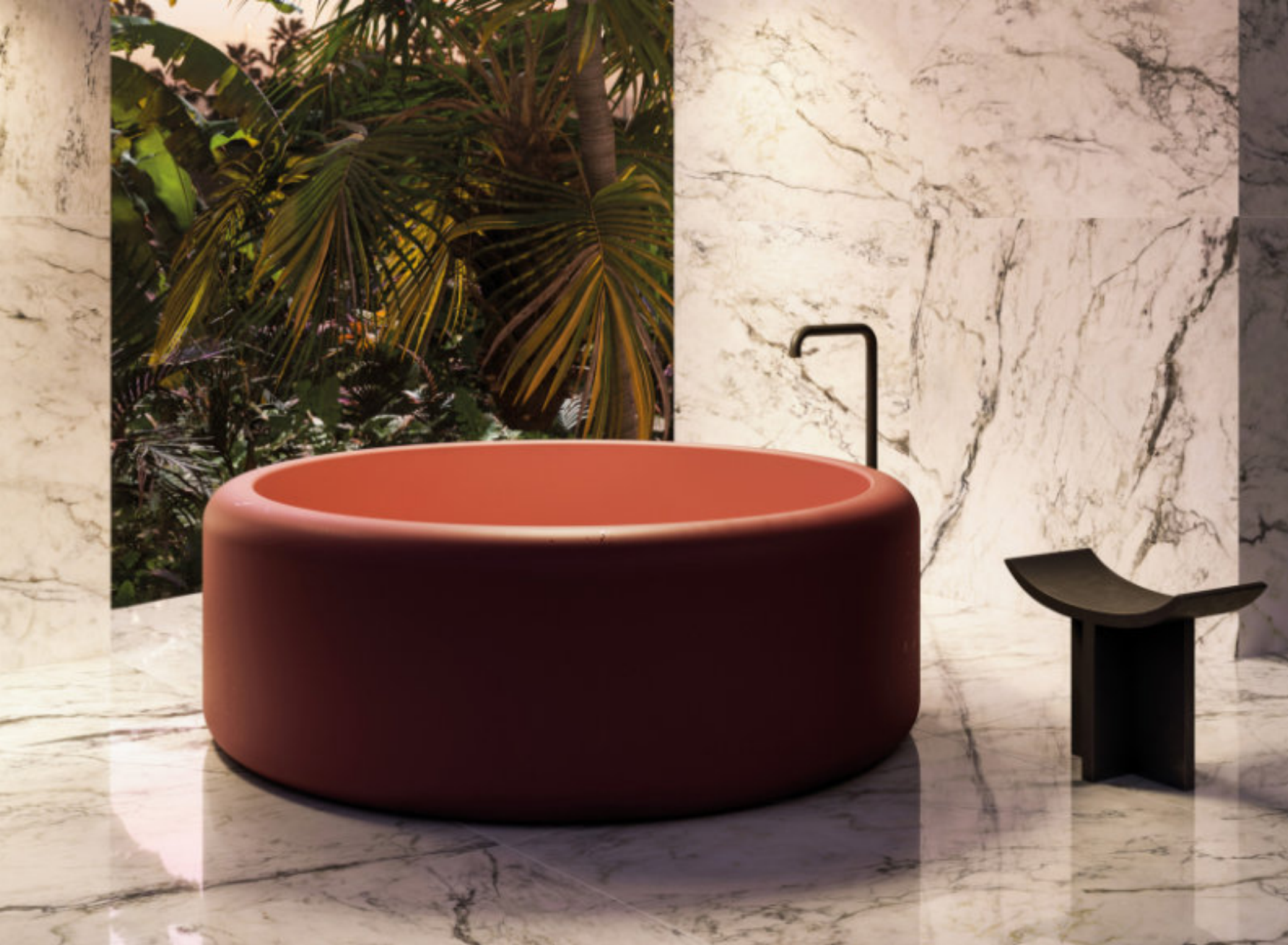
Dream Pure Breccia Capraia 120 × 120