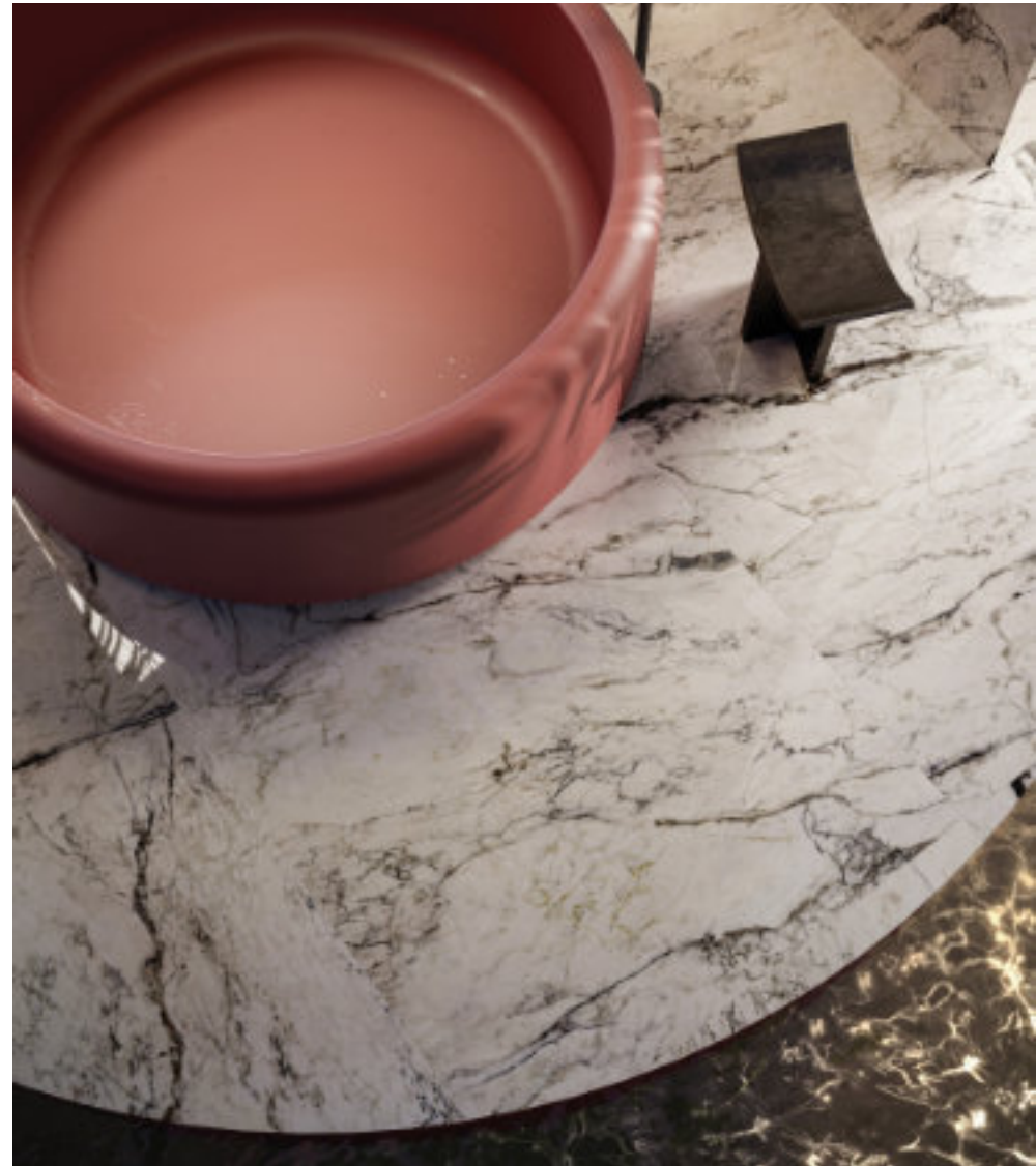
Dream Pure Breccia Capraia 120 × 120