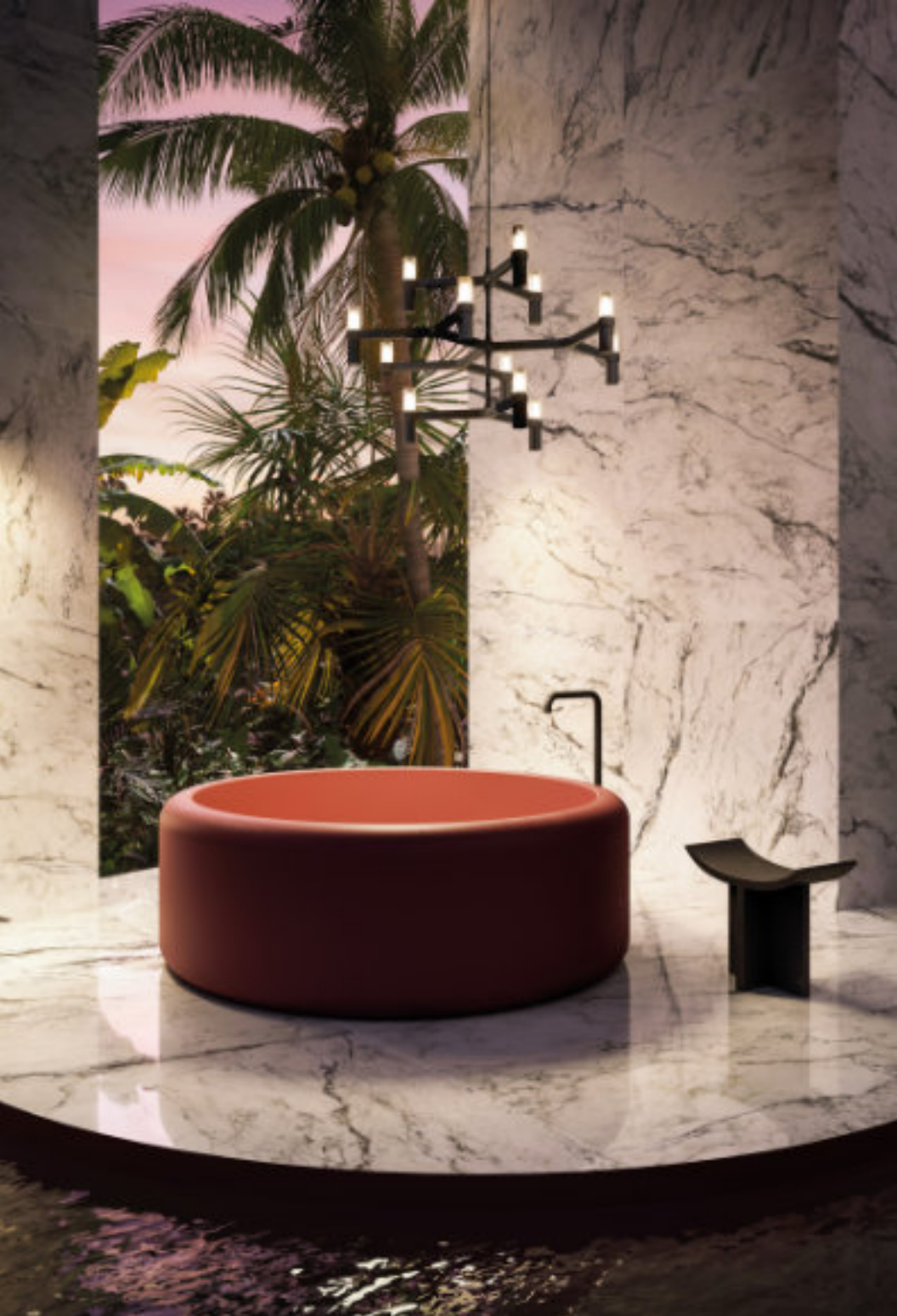
Dream Pure Breccia Capraia 120 × 120